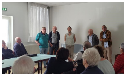
(4 Présidents pour une secrétaire)