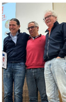
1ère paire N/S