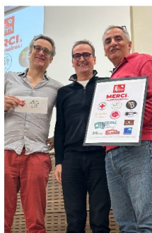
1ère paire E/O